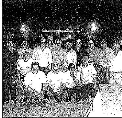
En la imagen, el jurado junto a los concursantes. R. Jurado