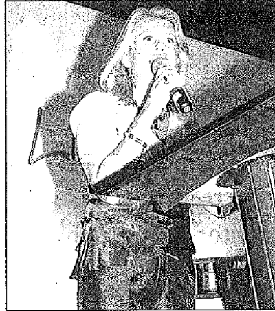
La alcaldesa de Marbella dio la bienvenida a los invitados. R. J.

M. E. Marbella "Food & Sun Festival" culminó anoche su primera edición en Marbella "con el logro de los objetivos marcados", según la alcaldesa de este municipio, Ángeles Muñoz.